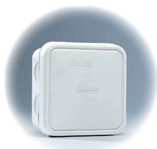
JB 2,5 - hvid