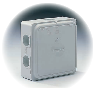
JB 6 - grå