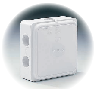
JB 6 - hvid