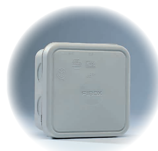
JB 2,5 - grå